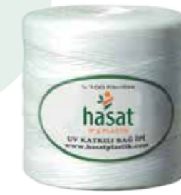
Paket Ölçüleri : 55x 82x15 Package Size : 55x82x15

Polypropilenden üretilip %100 fibrilize işlemi ile sağlamlık ve yumuşaklık verilmiştir. UV katkısı ile güneşin zararlı ışınlarının yol açtığı kırılma ve renk solması önlenerek dayanma süresi uzatılmıştır. Shrinklidir. Bobin bitene kadar dağılmaz. Zirai ilaç ve güneş ışınlarına karşı dayanıklıdır. Organik Tarım (Topraksız Tarım) yapılan seralarda kullanılır. Takribi 1000 metresi 1 kg'dır. 9000 denye kalınlığındadır.