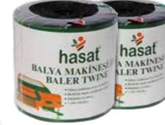
Koli Ölçüleri : 24x 26x48 Package Size : 24x26x48

Polypropilenden mamüldür, Güneş ışınlarına karşı katkı, %100 fibrilizedir. Mukavemeti yüksek, taşıma gücü 100 kg'dır. Takribi 1 kg. 340 metredir, Shrinkli 5'er kg. bobinler halindedir. 10 kg.lık kutulu ambalaj şeklindedir. Bobini bitene kadar dağılmaz, Elyafları birbirine bağlı ağ şeklindedir, eksiksizdir. Düğümü çözülmez. 27000 denye kalınlığındadır.