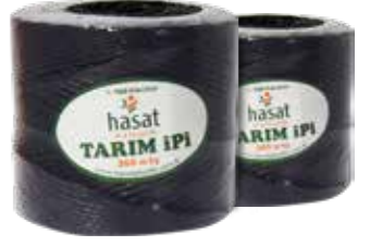
Paket Ölçüleri : 55x 82x15 Package Size : 55x82x15