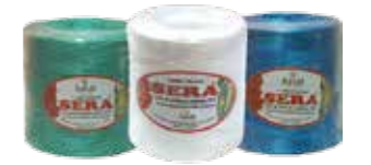
Paket Ölçüleri : 55x 82x15 Package Size : 55x82x15

Polypropilenden üretilip %100 fibrilize işlemi ile sağlamlık ve yumuşaklık verilmiştir. UV katkısı ile güneşin zararlı ışınlarının yol açtığı kırılma ve renk solması önlenerek dayanma süresi uzatılmıştır. Shrinklidir. Bobin bitene kadar dağılmaz. Zirai ilaç ve güneş ışınlarına karşı dayanıklıdır. Masurasızdır. 5000 denye kalınlığındadır. Mukavemeti 20 kg'dır. 1kg/1650 m