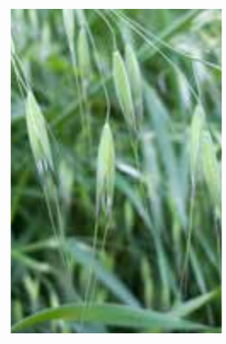
Kısır Yabancı Yulaf ( Avena sterilis L. )