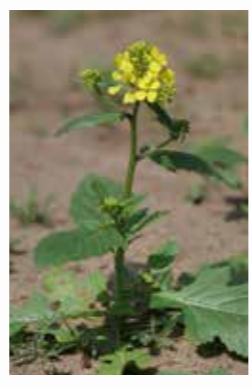
Yabancı Hardal ( Sinapis arvensis L. )