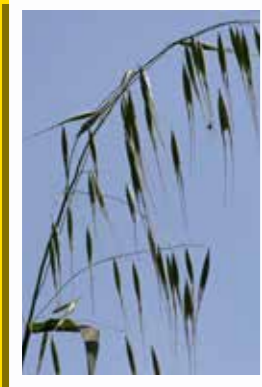
Yabancı Yulaf ( Avena fatua L. )