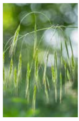
Kısır Brom ( Bromus sterilis L. )